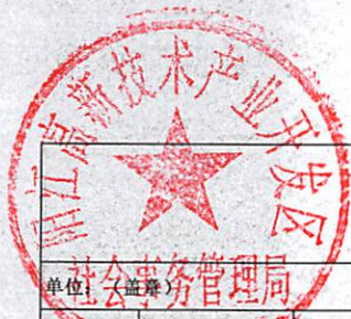
阳江滨海新区（阳江高新区）平冈镇乡村振兴驻镇帮镇扶村2023年资金项目入库表