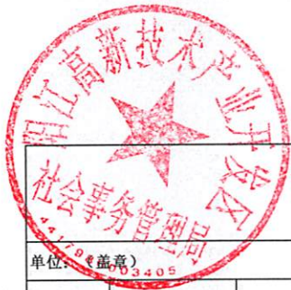
阳江滨海新区（阳江高新区）平冈镇乡村振兴驻镇帮镇扶村2023年资金项目入库表