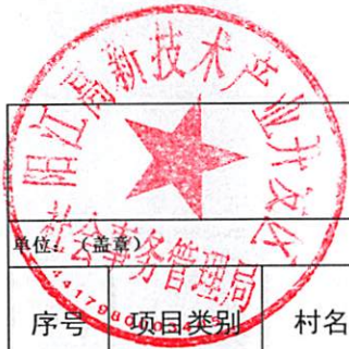
阳江滨海新区（阳江高新区）平冈镇乡村振兴驻镇帮镇扶村2023年资金项目入库表