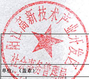
阳江滨海新区（阳江高新区）平冈镇乡村振兴驻镇帮镇扶村2023年资金项目入库表